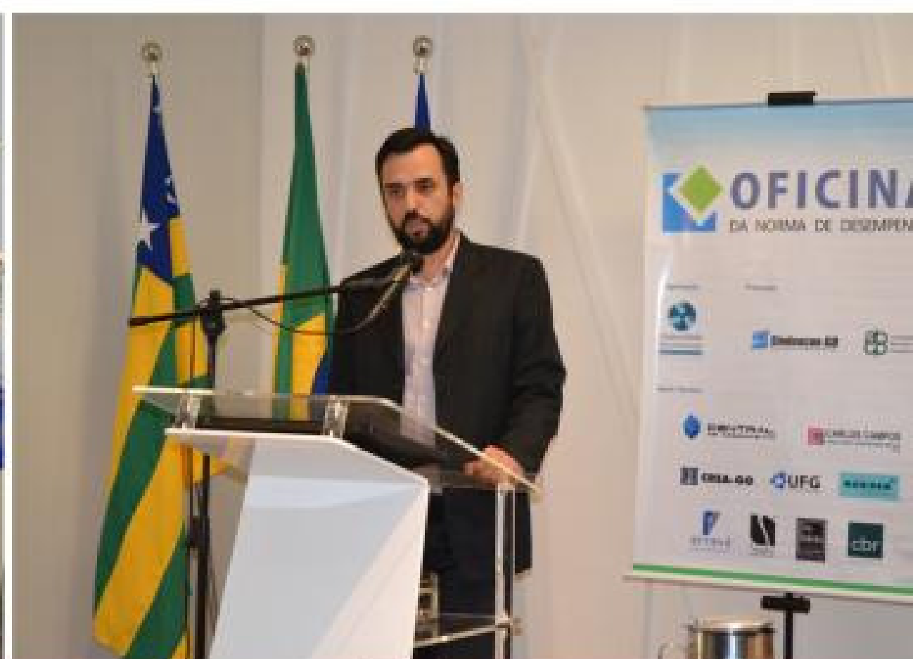
XII Oficina da Norma de Desempenho