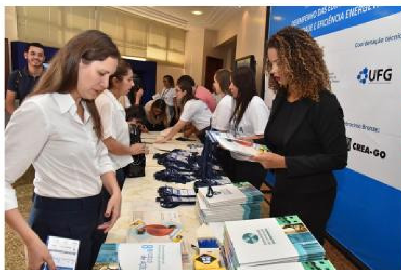
Recepção aos seminaristas da XI Oficina da Norma