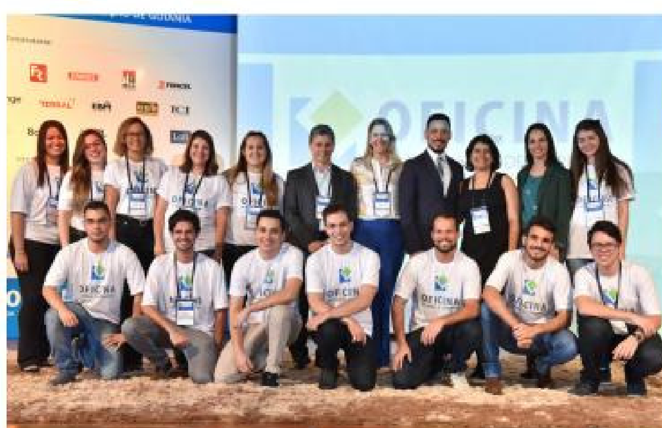
Parte dos integrantes da equipe de organização e apoio da XI Oficina da Norma