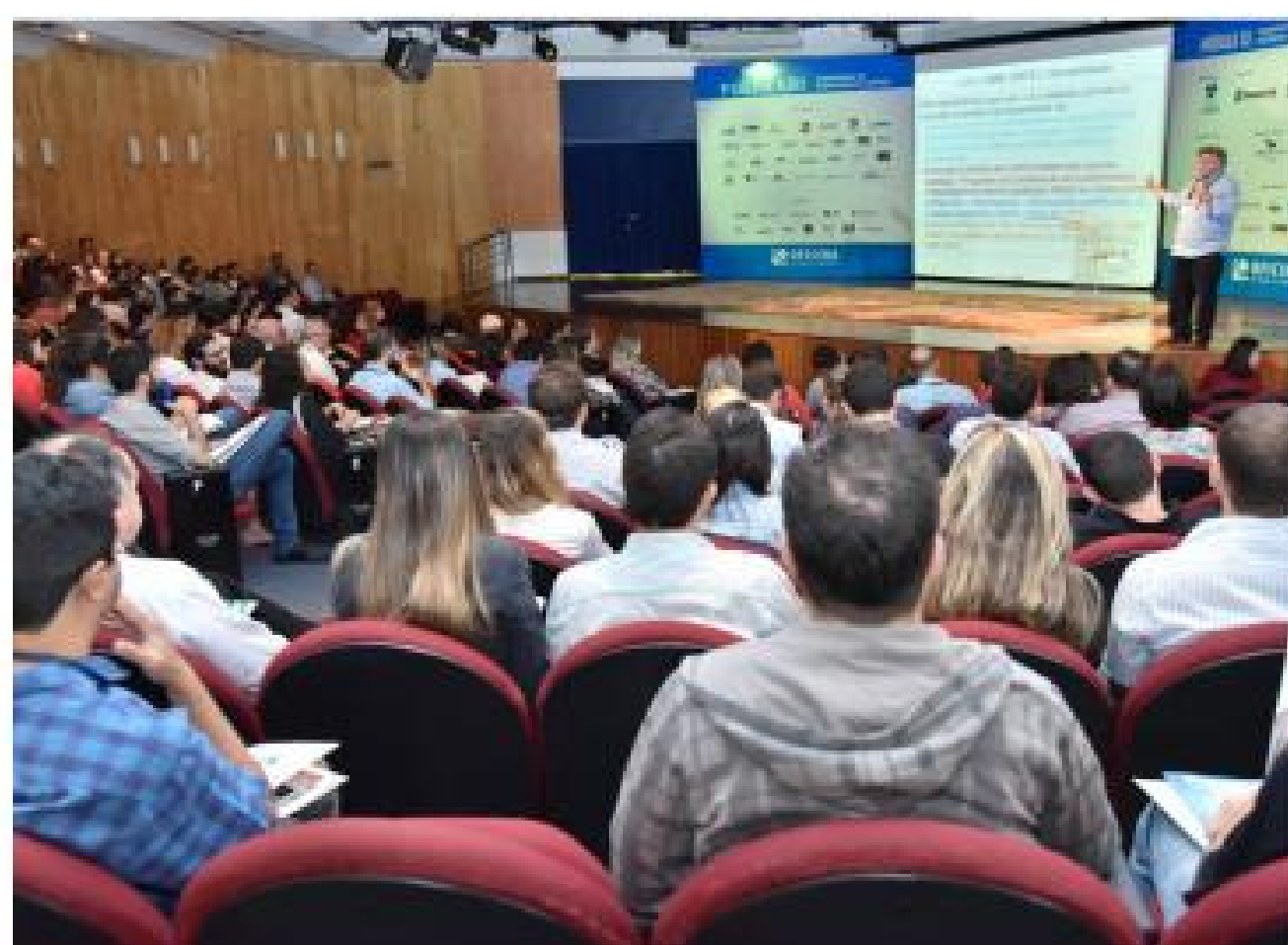
Oficina da Norma de Desempenho Módulo XI: Desempenho das Edificações Sustentabilidade e Eficiência Energética