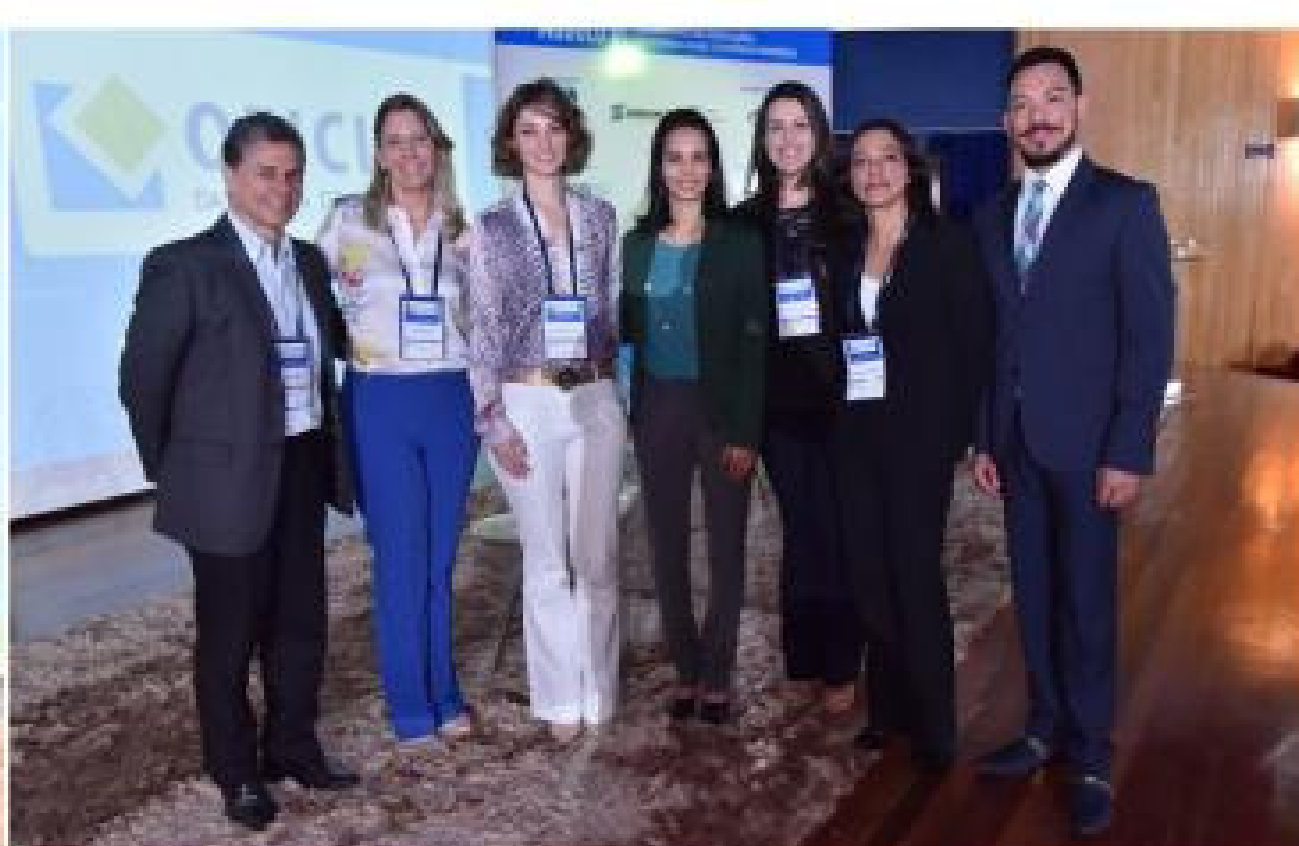
Alguns dos palestrantes e coordenadores da XI Oficina da Norma