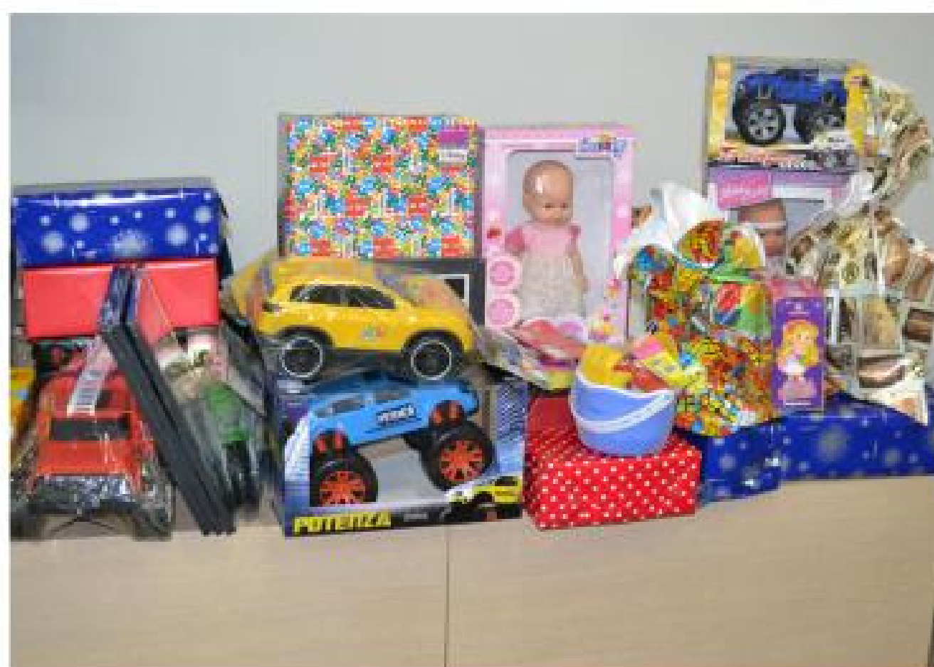
Brinquedos arrecadados na campanha