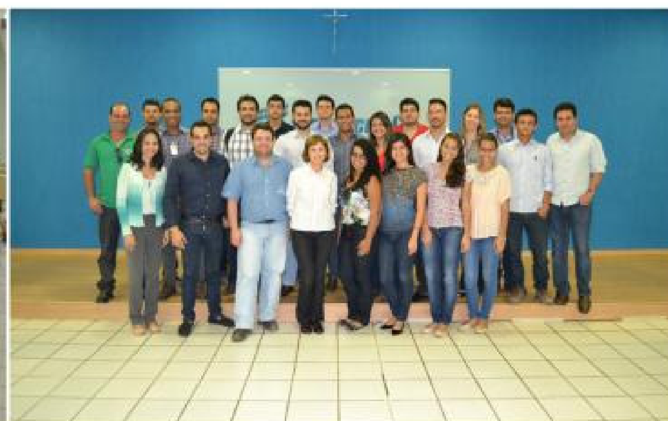
Participantes do grupo de trabalho

A migração para um sistema mais racionalizado requer uma mudança cultural dentro das empresas, visto que essa opção implica na mecanização de todo o processo, desde a dosagem da argamassa até a sua projeção na base. Por esse motivo, o GT de Argamassa Projetada iniciará, em 2017, seu terceiro ano de atuação. Junto às atividades regulares do grupo ocorrerá o acompanhamento de uma pesquisa de mestrado a ser realizada no âmbito do Programa de Pós-Graduação em Geotecnia, Estruturas e Construção Civil (PPG-GECON), da Escola de Engenharia Civil e Ambiental da UFG (EECA-UFG). A pesquisa contará com o apoio da Comunidade da Construção de Goiânia e com patrocínio da Votorantim Cimentos.