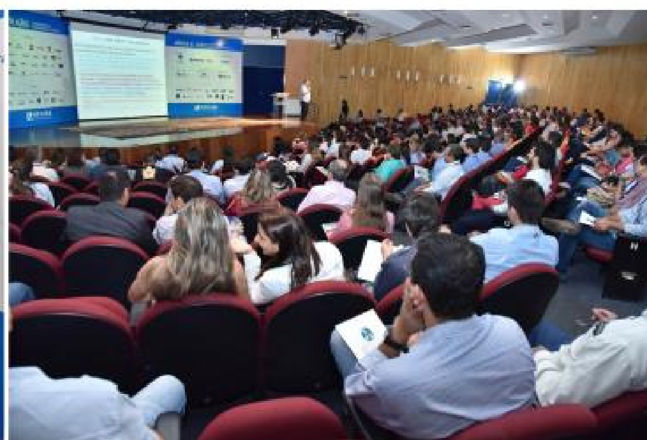
Público participante do primeiro dia de evento