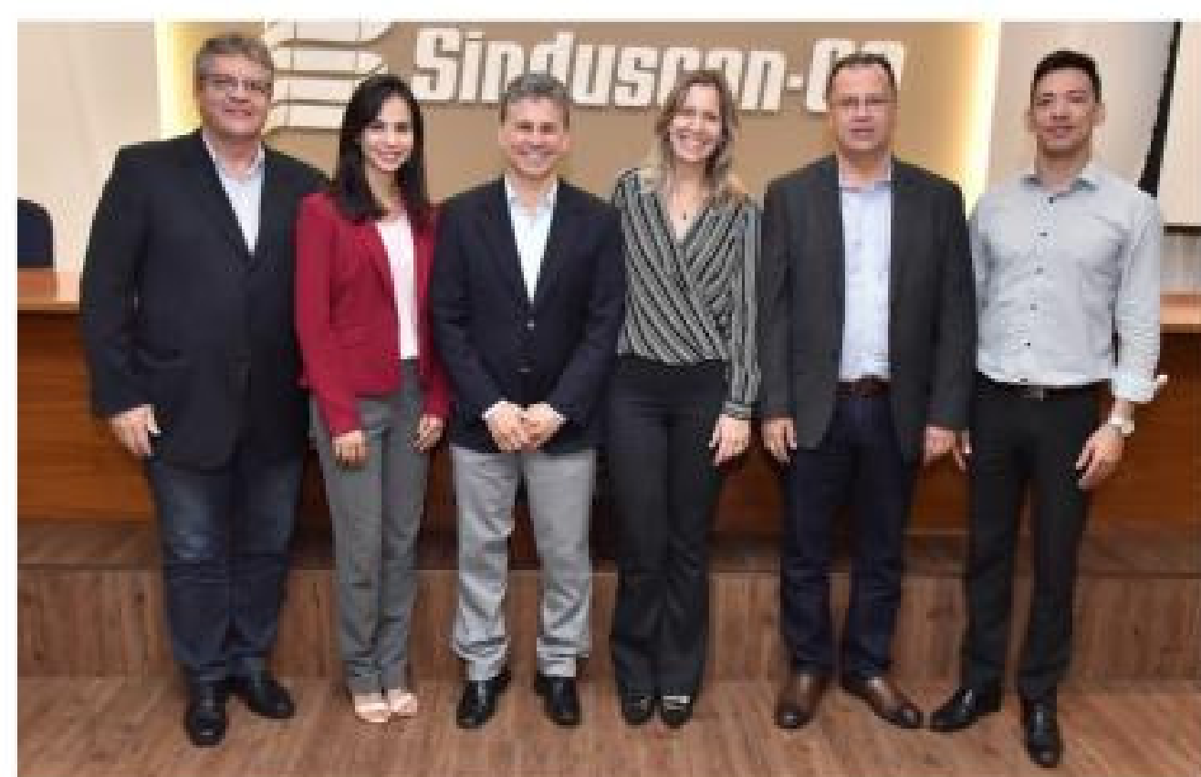
Coordenação do programa Comunidade da Construção de Goiânia