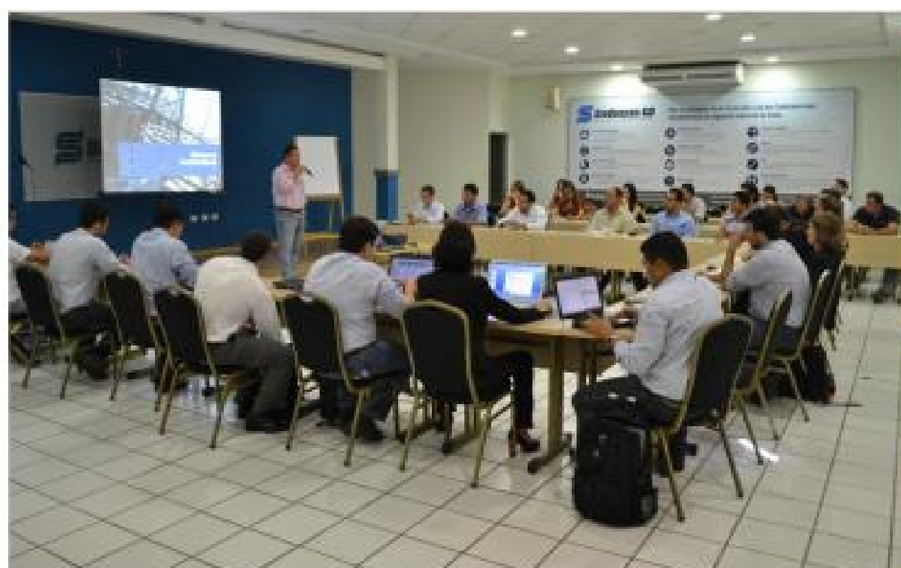
Reunião do GT de Argamassa Projetada

Em dois anos de trabalho, o GT identificou e debateu quanto aos pontos críticos da projeção de argamassa nos canteiros de obras, propondo ações de curto, médio e longo prazo, as quais foram implementadas por integrantes desse grupo. As iniciativas tiveram como finalidade eliminar e/ou minimizar os principais gargalos elencados, bem como demonstrar a competitividade da projeção mecanizada.