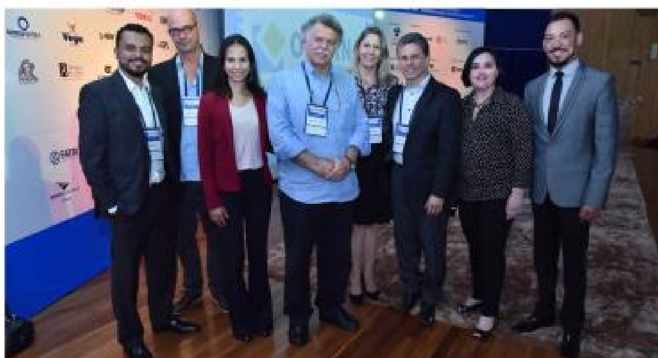
Alguns dos palestrantes e coordenadores da XI Oficina da Norma