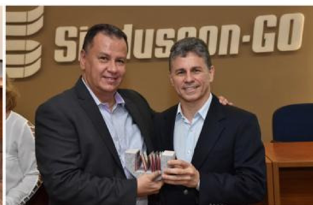
Coordenadores da Comunidade da Construção de Goiânia