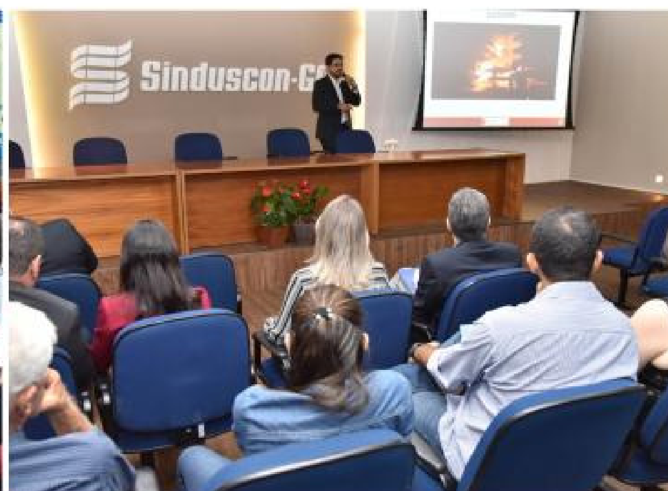
Encerramento do 9º Ciclo de Ações da Comunidade da Construção de Goiânia