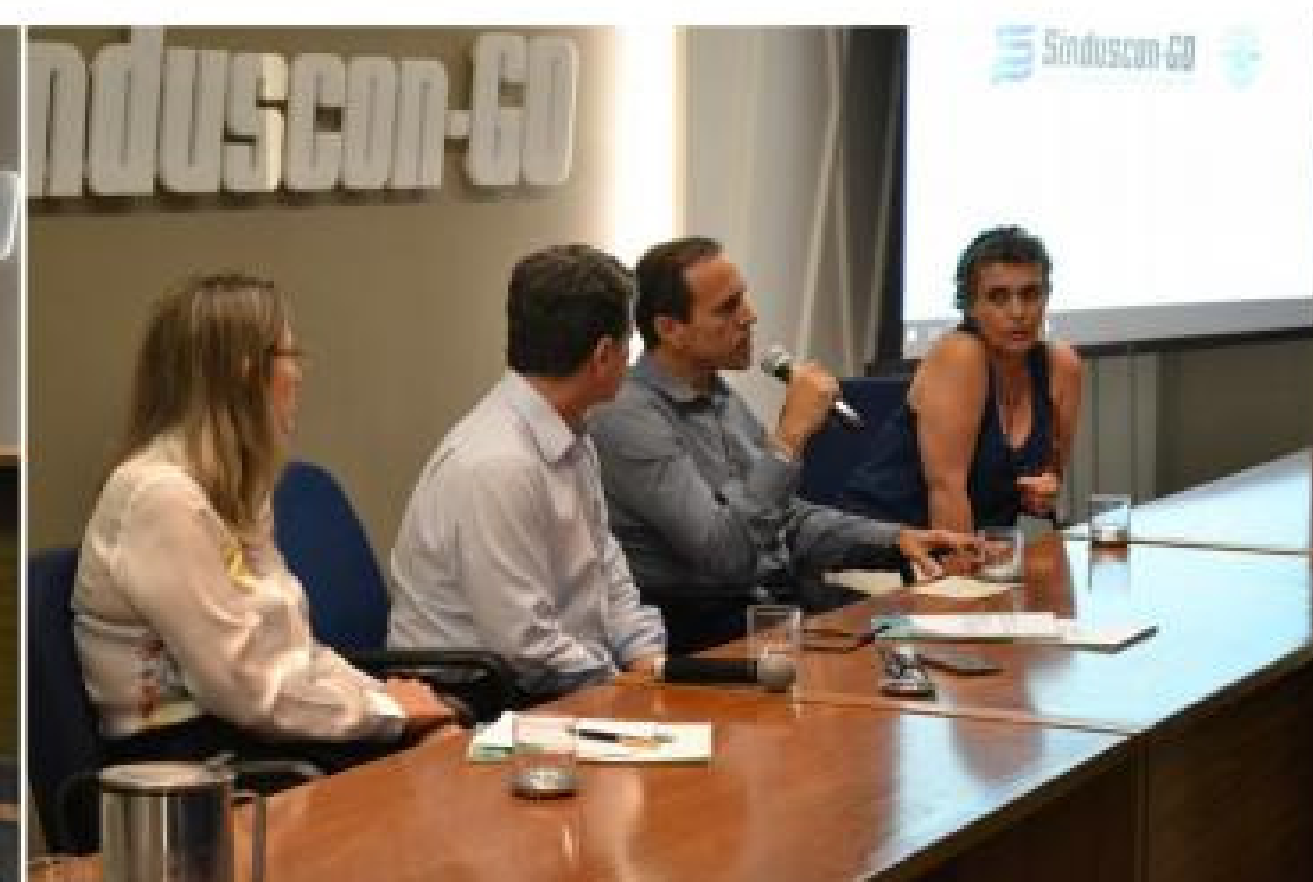
Mesa de debates