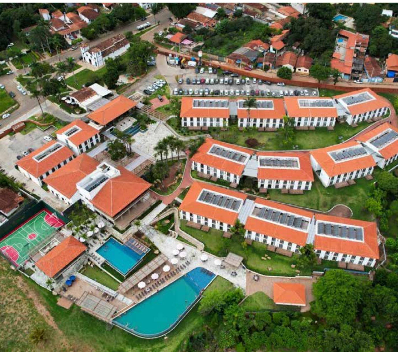
Quinta Santa Barbara - Pirenópolis