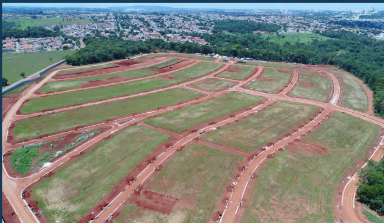
INFRAESTRUTURA E SANEAMENTO